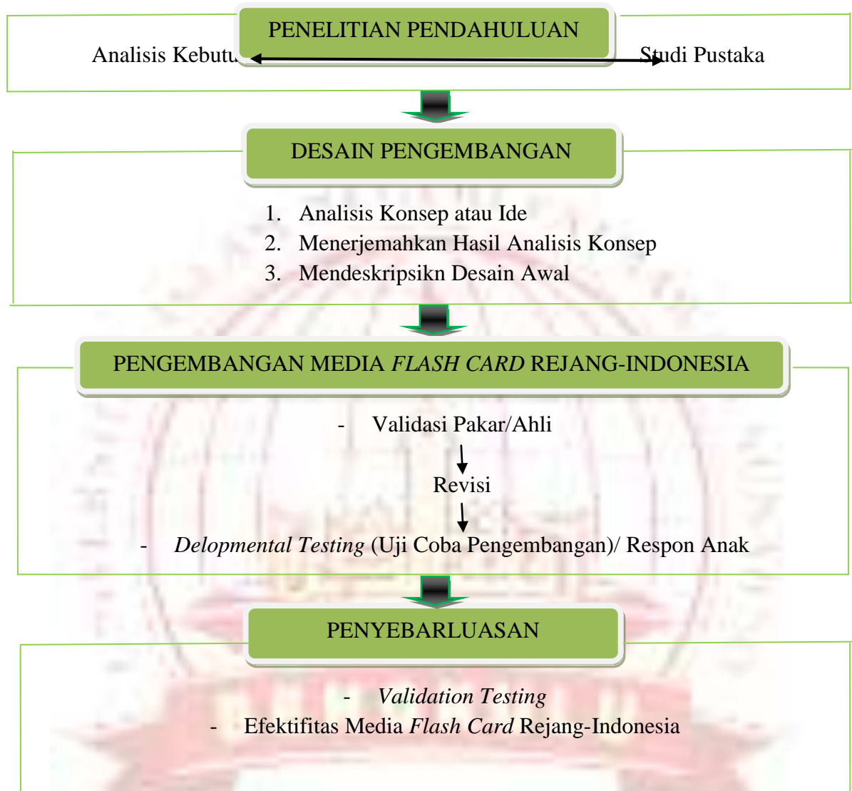
Gambar 2.3 Rancangan Prosedural Media Flash Card Rejang-Indonesia