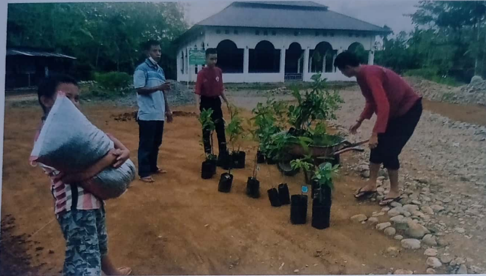
Gambar III.1 Potret penghijauan bersama warga setempat

Dalam Objek penamping dalam pelaksanaan program dibantu oleh santri Pesantren Al-Ittifaq karena lahan kosongnya yang kami gunakan sebagai penghijauan, serta Seluruh komponen warga masyarakat yang berada di Desa Gunung Agung Kabupaten Bengkulu Utara.