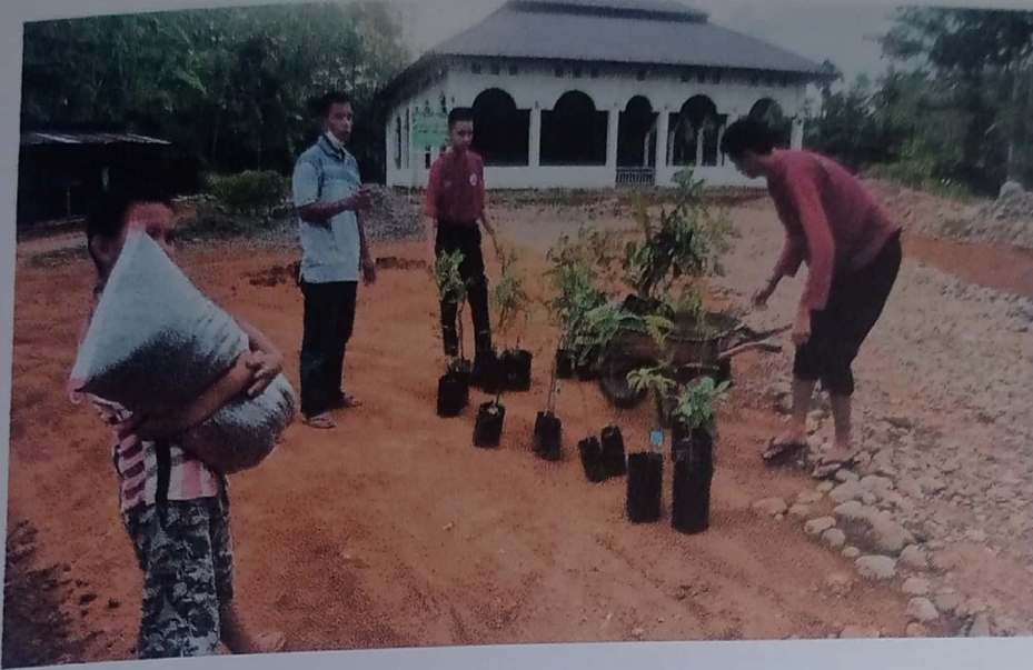
Lampiran.3 Proses penanaman bibit pohon buah dilahan kosong