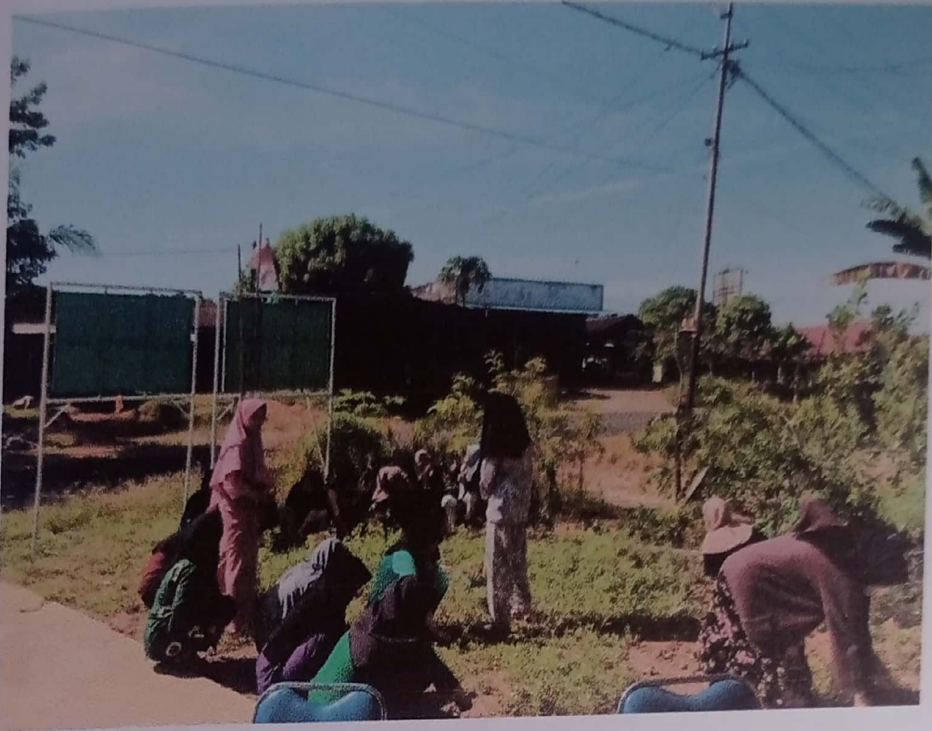
Lampiran.1 Pembersihan lahan dari rumput liar untuk ditanami bibit pohon buah