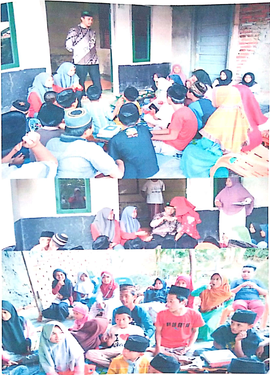
PROGRAM KERJA Membantu Mengajar Anak Mengaji