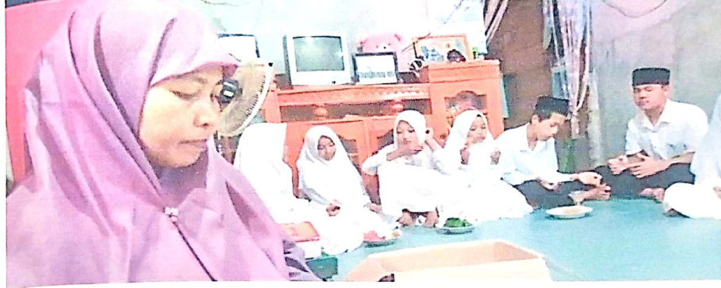
Telah Terlaksanakan Khotaman Quran TPQ Al-Hafidz Desa Sidodadi Kec. Pondok Kelapa