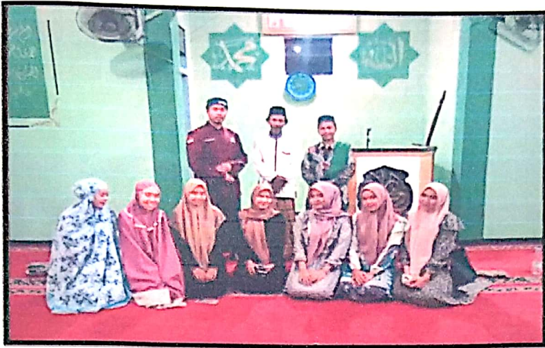
N U Z U L Q U R A N