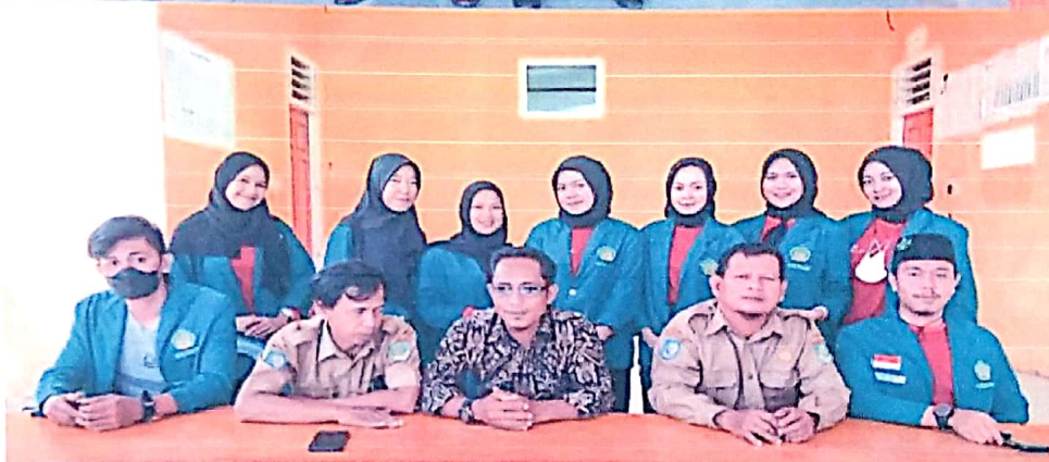
Rapat dan laporan Program kerja dari Mahasiswa KKN 2022 UINFAS Bengkulu di Desa sidodadi, Kec Pondok kelapa Bengkulu Tengah