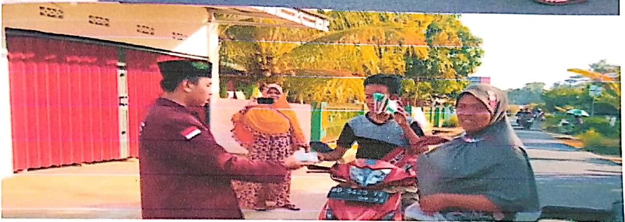
Program Kerja Kelompok 121 Pembagian Takjil Gratis