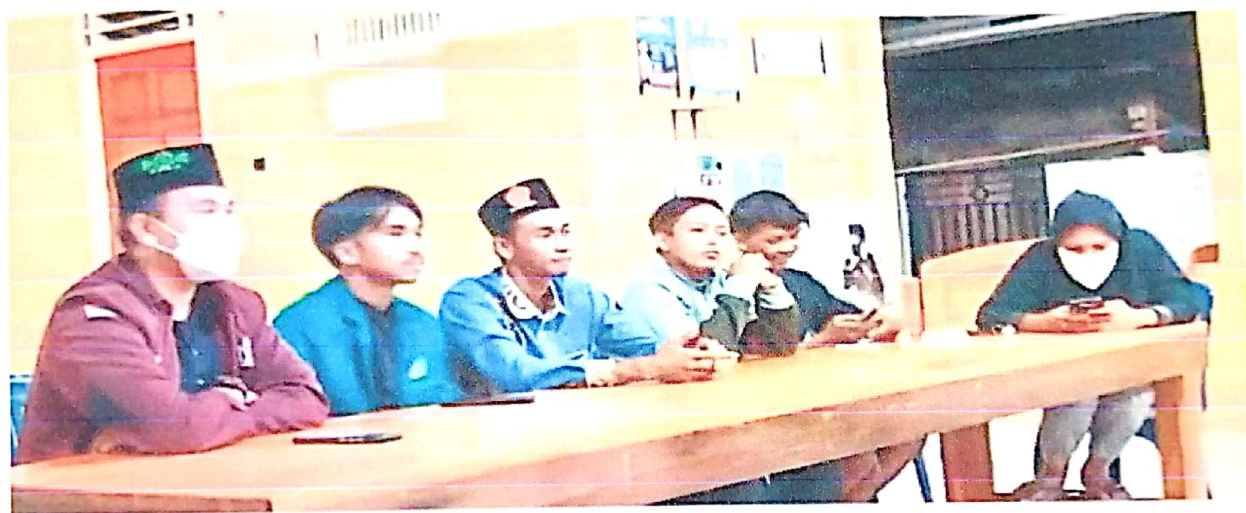
Rapat Bersama Karang Taruna " Bersama kelompok KKN 121 & 122 Berkenalan dan menyampaikan Program Kerja "