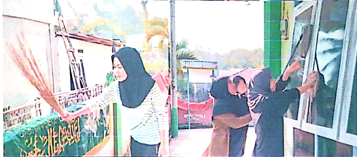
PROGRAM KERJA Gotong royong membersihkan Masjid setiap hari Jum'at