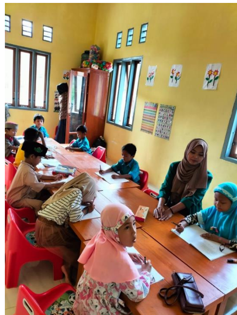
Gambar 1.7 Kegiatan KBM di PAUD Gema Gembira desa Gajah Mati