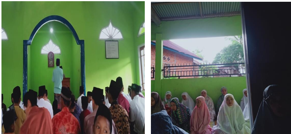
Gambar 1.19 Sholat hari raya idul fitri di Masjid At-Taqwa