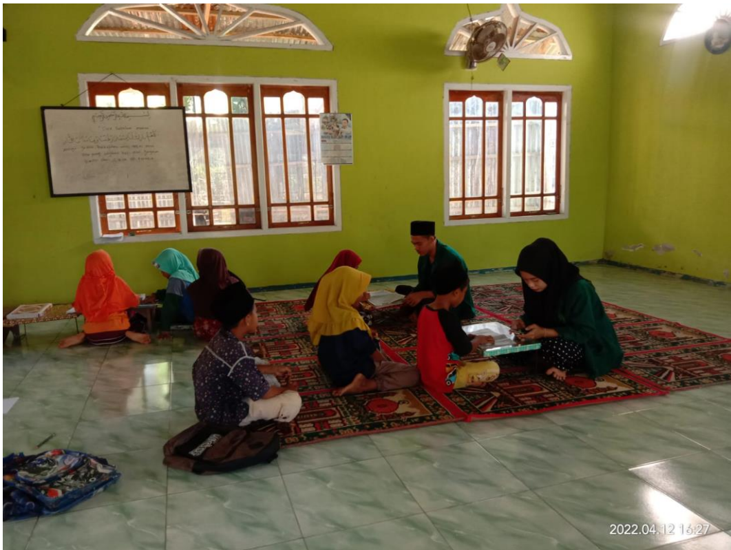
Gambar 1.4 Mengajar Ngaji di Masjid at-Taqwa