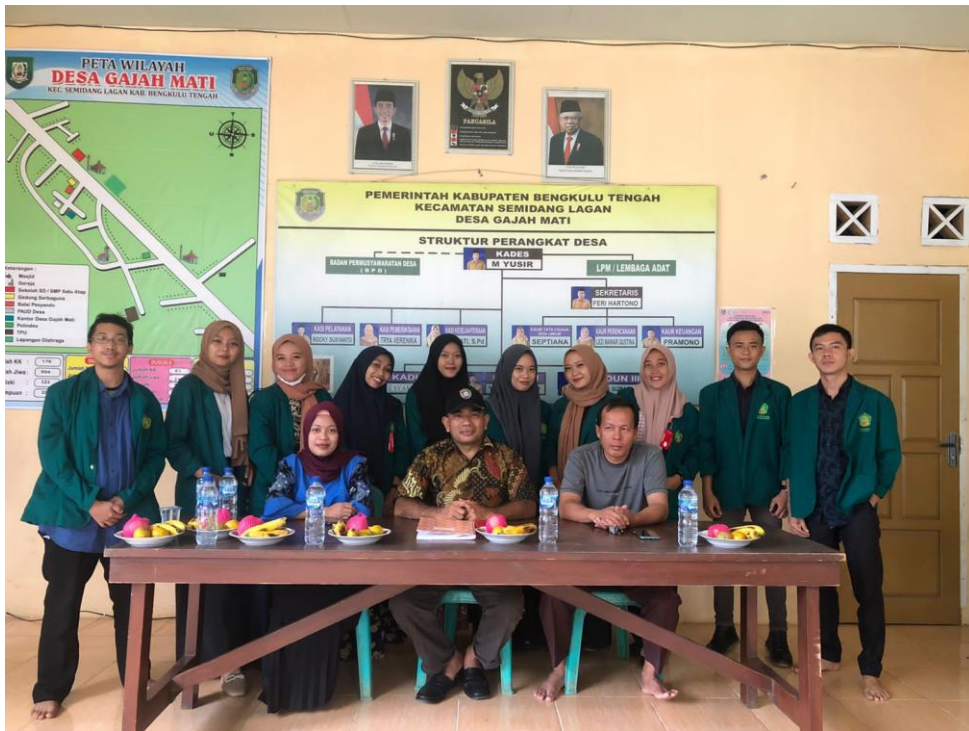
Gambar 1.21 Penarikan Mahasiswa KKN kelompok 23