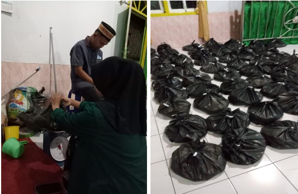
Gambar 1.18 Kegiatan pembagian zakat fitrah