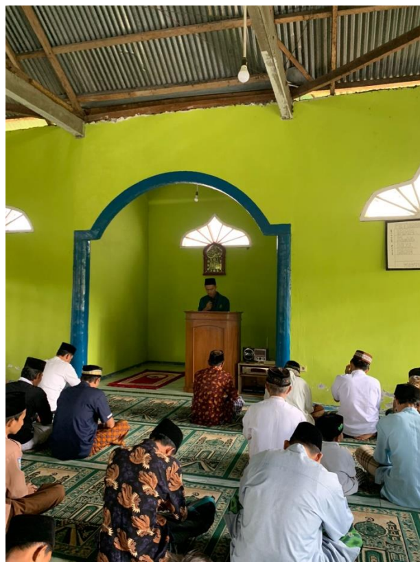
Gambar 1.11 Kegiatan khutbah sholat jum'at yang di isi oleh mahasiswa KKN kelompok 23