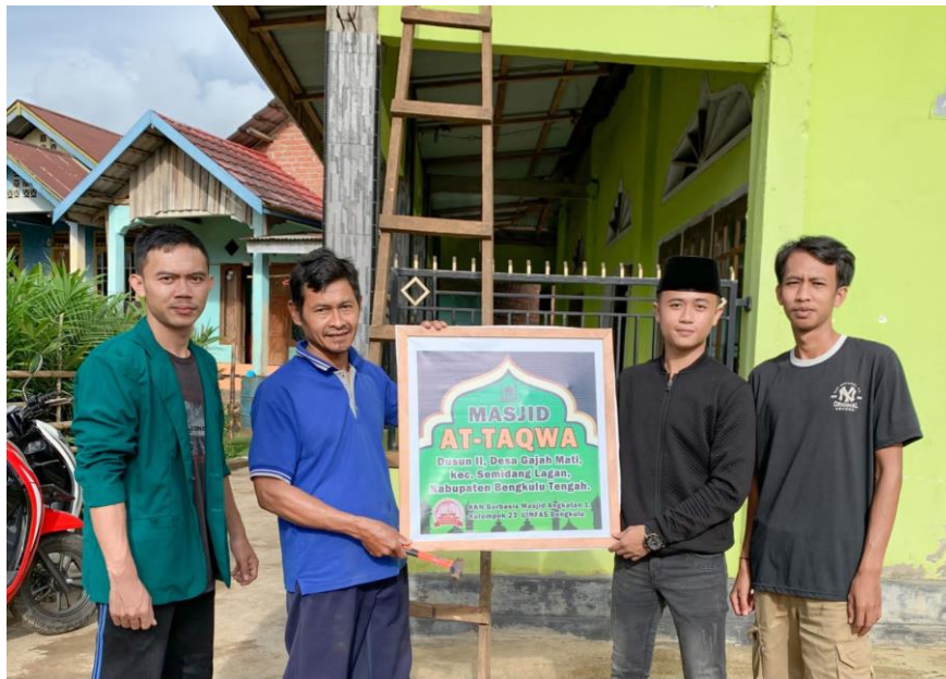
Gambar 1.10 Kegiatan pembuatan papan nama Masjid at-Taqwa