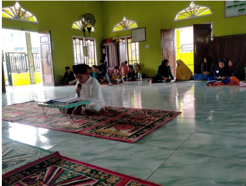
Gambar 1.14 Kegiatan lomba memperingati Nuzulul Qur'an