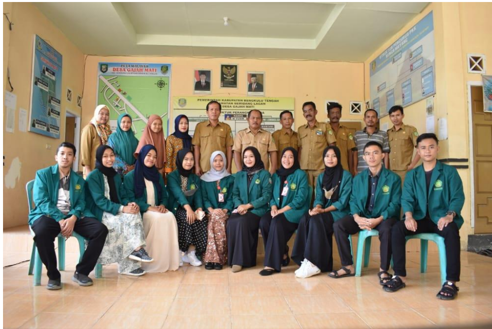
Gambar 1.2 Penyerahan Peserta KKN IAIN BENGKULU Angkatan I 2022 Di desa Gajah Mati, Kec.Semidang Lagan, Kab. Bengkulu Tengah