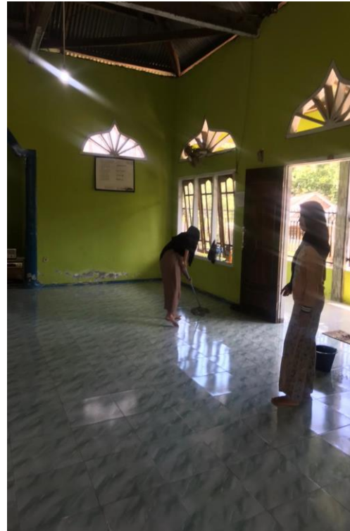
Gambar 1.12 Kegiatan kebersihan masjid setiap hari Jumat