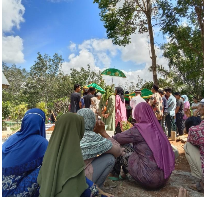
Gambar 1.8 Menghadiri pemakaman