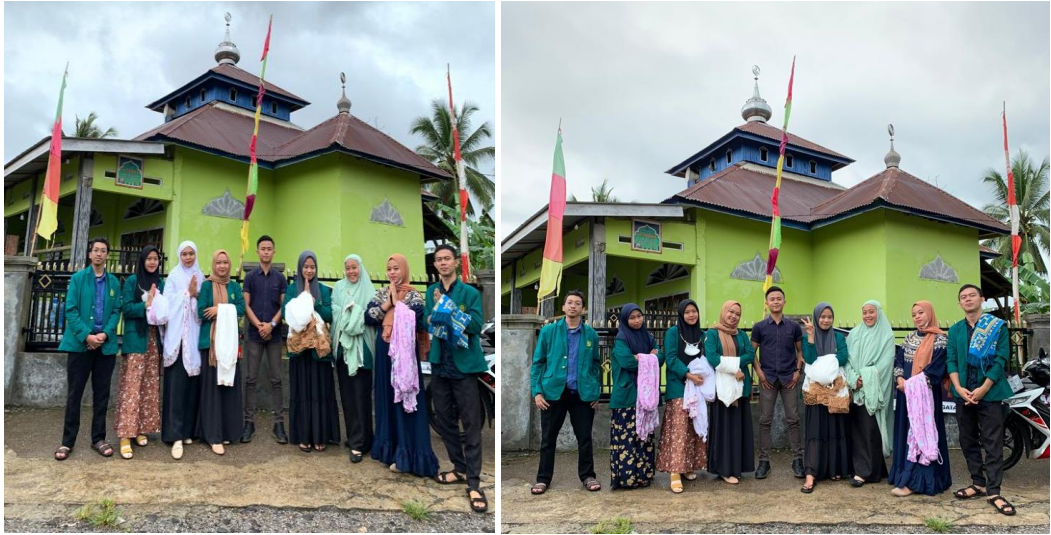
Gambar 1.20 Foto hari raya idul fitri