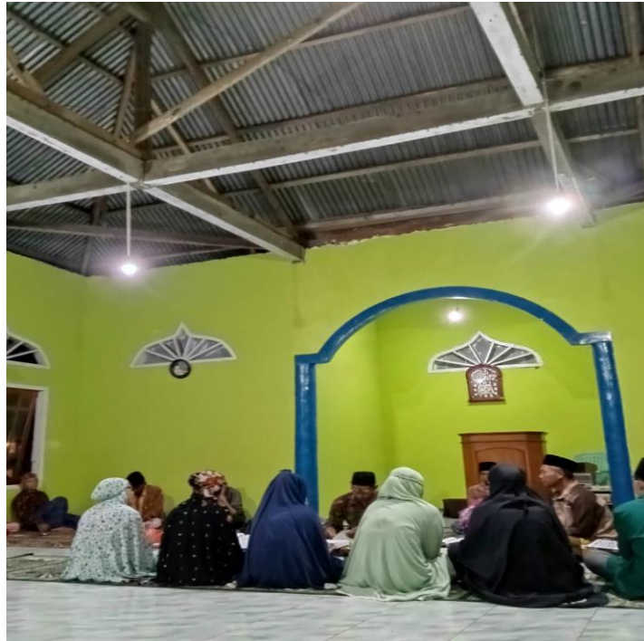
Gambar 1.16 Kegiatan khataman Qur'an di Masjid At-Taqwa