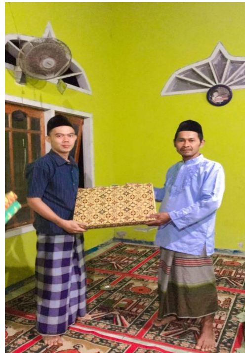
Gambar 1.13 Kegiatan penyerahan fasilitas masjid seperti Al-Qur'an dan meja