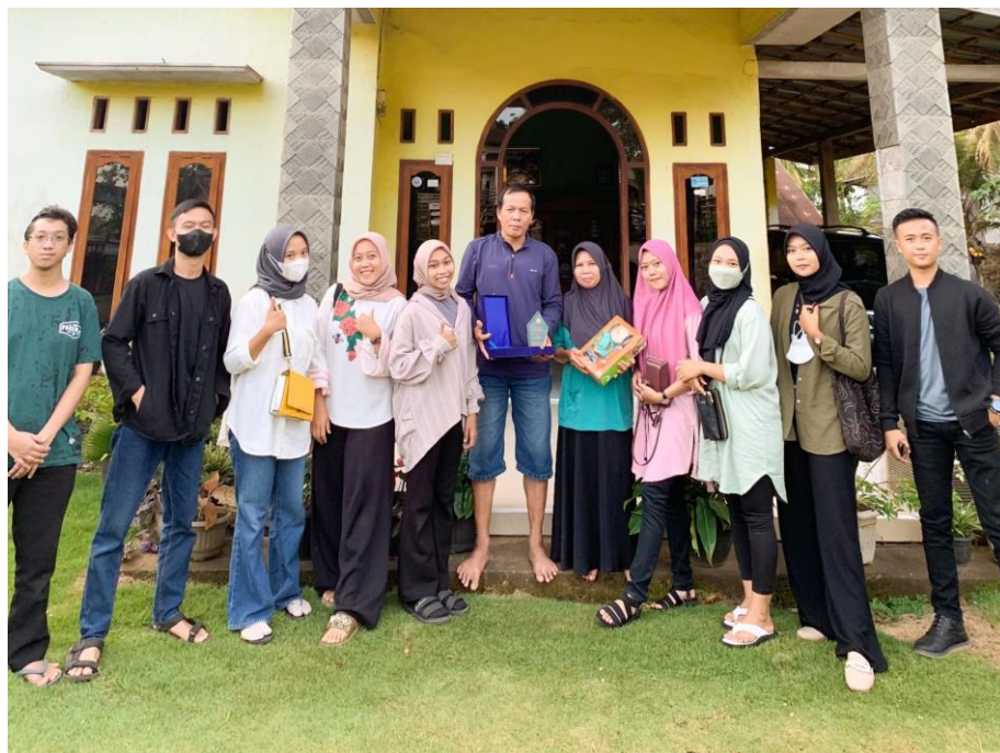
Gambar 1.22 Pemberian cendera mata kepada kepala desa oleh kelompok 23