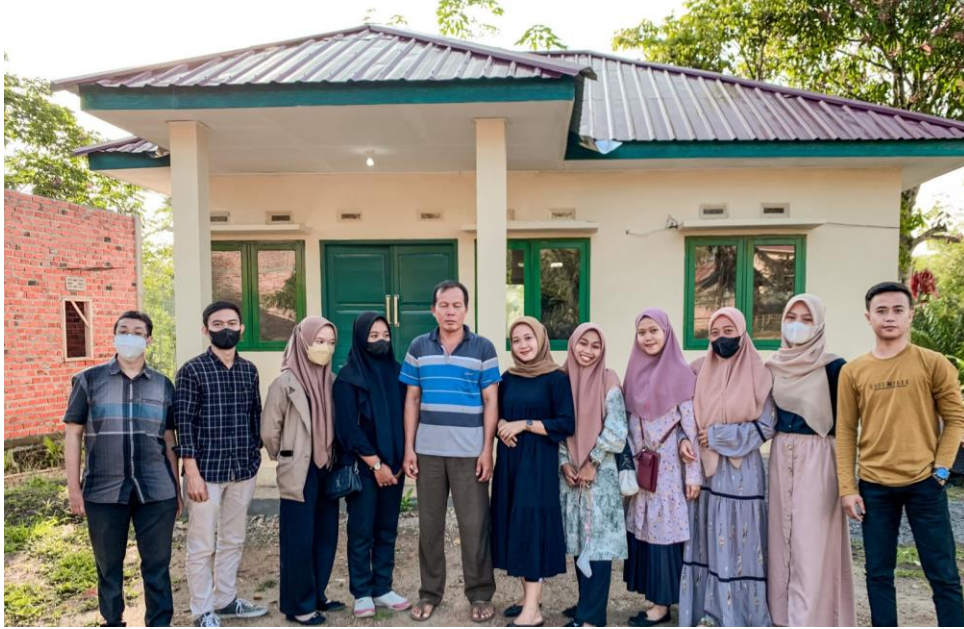
Gambar 1.1 Survey Lokasi KKN dan Pertemuan Dengan Bapak Kades Desa Gajah Mati