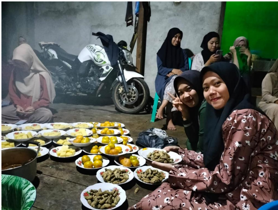
Gambar 1.3 LOKA KARYA Peserta KKN Kelompok 22 dan 23 Desa Gajah Mati