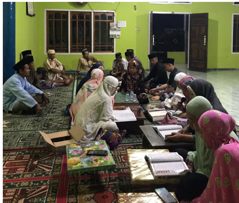
Gambar 1.5 Kegiatan Tadarus bersama