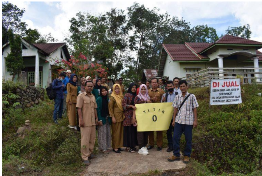
Gambar 1.9 Kegiatan Pembukaan jalan baru beserta platdeuker 2 unit di desa Gajah Mati