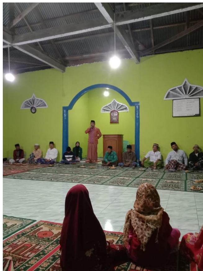
Gambar 1.15 Kegiatan malam Nuzulul Qur'an