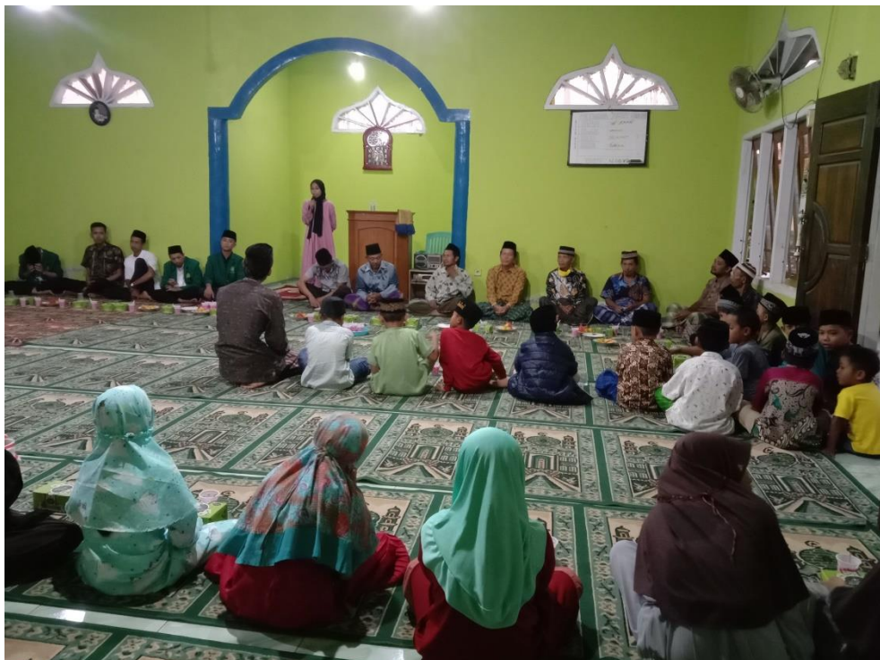
Gambar 1.6 Kegiatan buka bersama di Masjid At-Taqwa