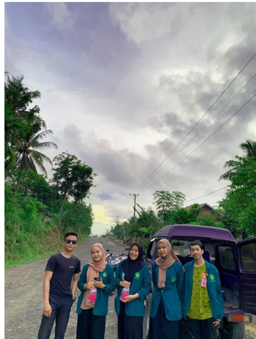
Gambar 1.17 Kegiatan Berbagi Takjil Gratis