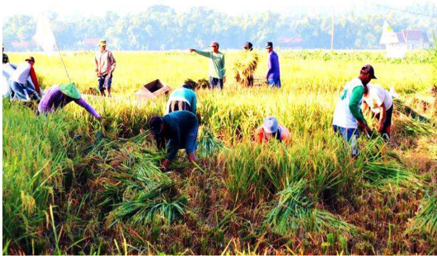
Gambar 2.1 Kegiatan Panen Padi

Hubungan antar manusia baik berkelompok maupun individu mengarahkan pada perubahan dan perkembangan masyarakat itu sendiri. Munculnya industri disuatu daerah akan menimbulkan dampak bagi masyarakat sekitar, seperti halnya di Desa Tango Raso. Setelah berdiri dan berkembangnya industri batu bata telah membawa pengaruh terhadap kehidupan sosial masyarakat sekitarnya. Hal ini dibuktikan dari hasil observasi dan dokumentasi penelitian penulis di lapangan, yakni sebagai berikut :