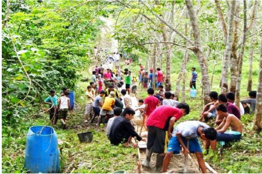
Gambar 2.2. Kegiatan Gotong Royong Warga sebagai bentuk kehidupan sosial warga yang masih terjalin baik

Berdasarkan hasil observasi penelitian di lapangan dapat penulis pahami bahwa kehidupan sosial masyarakat Desa Tanggo Raso masih terjalin dengan baik, hal ini dapat dilihat dari masih terlaksananya gotong royong, terlaksanakannya acara-acara seperti syukuran, tahlilan, gotong royong acara pernikahan, masih saling bahu membahu jika ada warga yang panen baik di kebun, sawah atau batu bata. 7