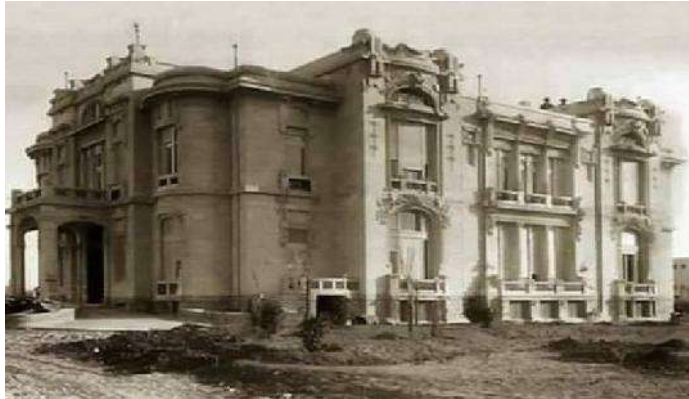
Gambar 2.3, Universitas Ain Shams