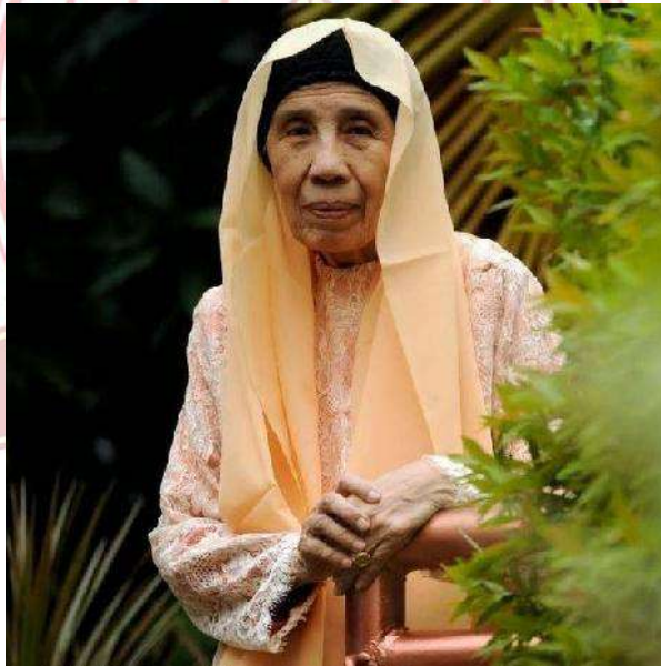
Gambar 2.1, potret Zakiah Daradjat

Zakiah Daradjat merupakan salah satu tokoh intelektual wanita Minangkabau yang dilahirkan dan dibesarkan di tanah kelahirannya, Kotomarpak. Kondisi alam Kotomarpak berhawa sejuk, berada diantara gunung Merapi dan Singgalang di Kecamatan Ampek Angkek, Kabupaten Agam, Sumatera Barat. Secara geografis letak Nagari Kotomarpak lebih dekat ke Kotamadya Bukittinggi, karena sebelumnya Kotomarpak memang bagian wilayah Kotamadya Bukittinggi. Setelah pemekaran, lalu Kotomarpak masuk ke wilayah Kabupaten Agam. 1