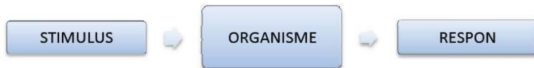
Gambar 2.1 Model Teori S-O-R

tindakan dan diberi respons oleh orang lain. McQuail menjelaskan bahwa elemen-elemen utama dalam teori ini yaitu pesan (stimulus: S), Komunikan (Organism: O) dan Respons (efek: R). 32